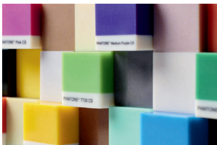
Bloques de color Pantone